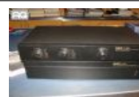
Pre-amplificatori+Finale QED C360 + P 360 € 390,00